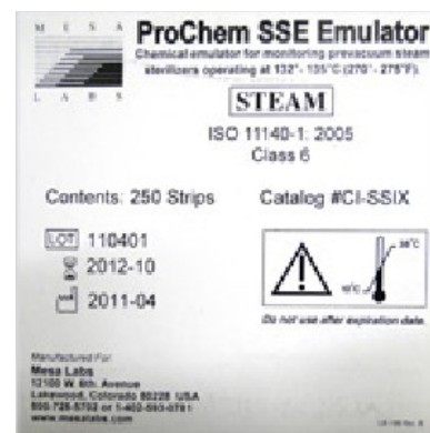
Catálogo # CI-SSIX 250 indicadores por pacote

ProChem SSE (Emulador de esterilização a vapor) é um AAMI / ISO Classe 6 Indicador Emulador Químico foi projetado para uso em esterilização a vapor. O ProChem SSE é único, pois é destinado a vários ciclos de esterilização a vapor: 3 minutos a 135°C (275°F) e 4 minutos a 132°C (270°F).